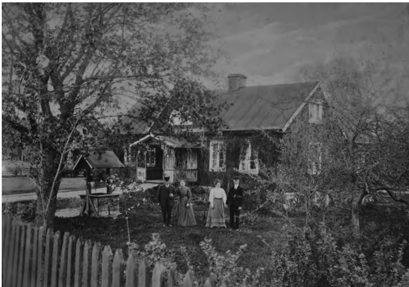
Sandsholm från 30-talet.