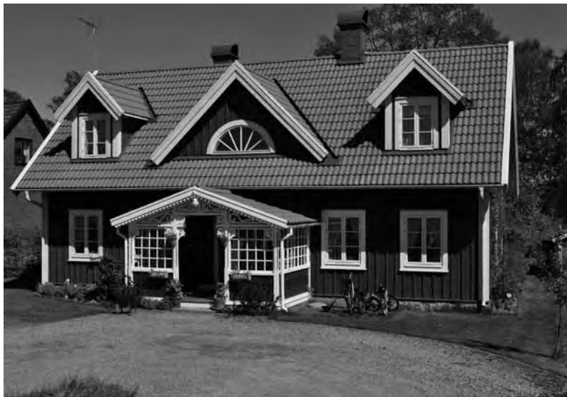
Så här ser Sandsholm ut idag.