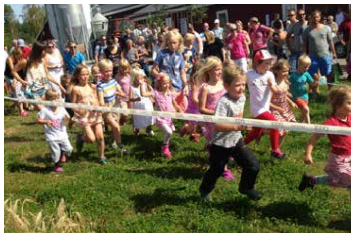
Här springer barnen hönsloppet.

Gör som kungen och drottningen åt Gårdsby Ägg Öppettider 07.00 – 20.00 alla dagar