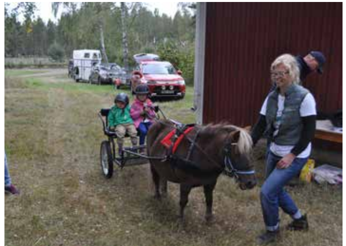
Ponnyridning är också populärt.