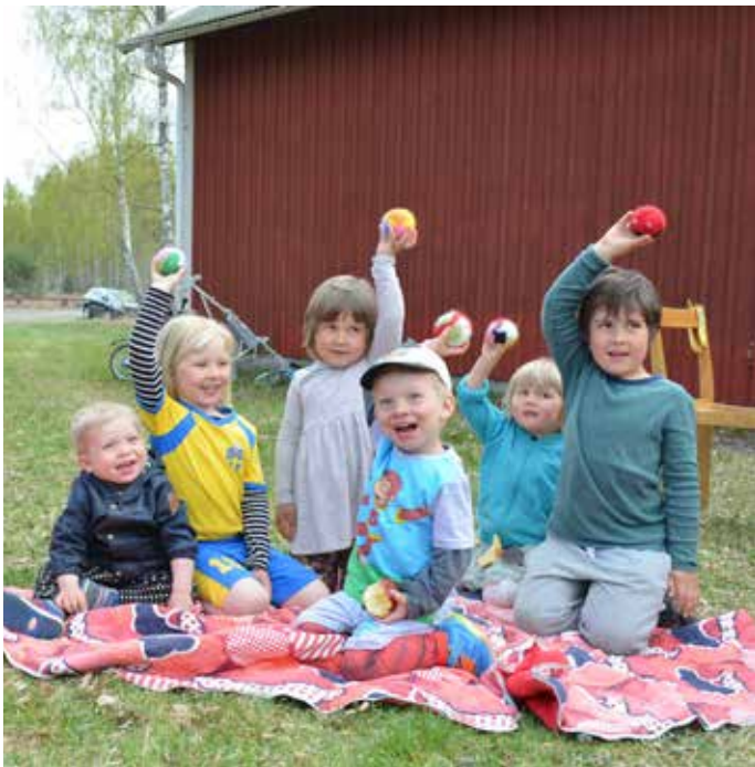
Alla barnen visar upp sina bollar.