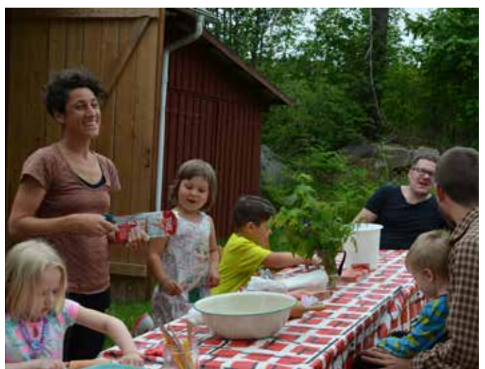
Trevlig stämning när små och stora skapade i lera.

Och du, följ oss gärna på Instagram; gardsby_hembygdforening och på Facebook; @gardsby.hembygdforening