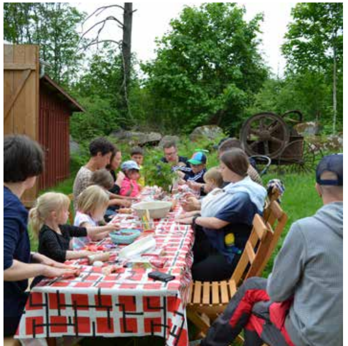
Vädret tillät långbord utanför magasinet under skapande verkstad.