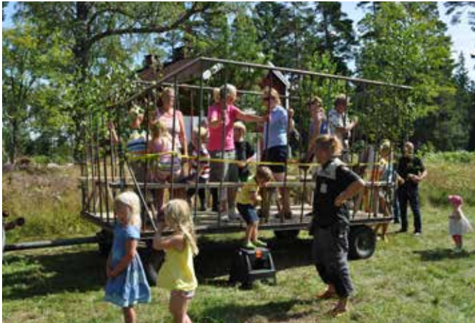
Barnen gillar att åka traktor och vagn.

Inga kostnader, men bli gärna medlem, enskild 100:- eller familj 150:-