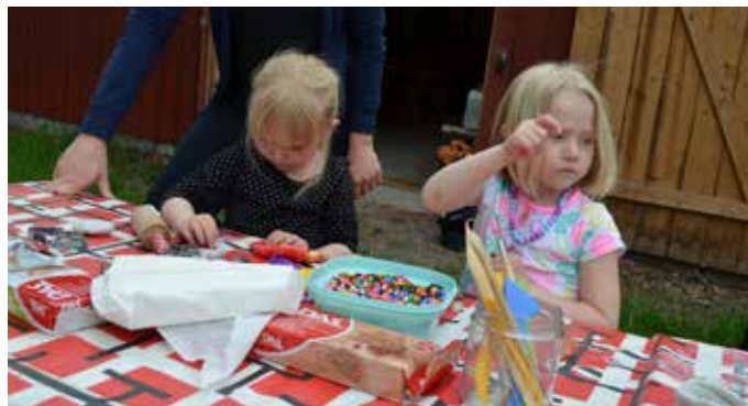
Fullt upp när lera och pärlor ska sammanfogas.

har varit mycket uppskattade av både barn och föräldrar och nya kontakter har knutits. Håll utkik i Gårdsbybladet och på anslagstavlor för efter sommaren planerar vi att dra igång fler tillfällen för skapande verkstad.