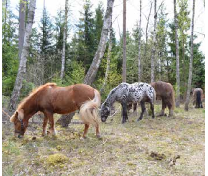
Stor variation i deltagande hästar under tipspromenaden med Kronobergskuskarna.