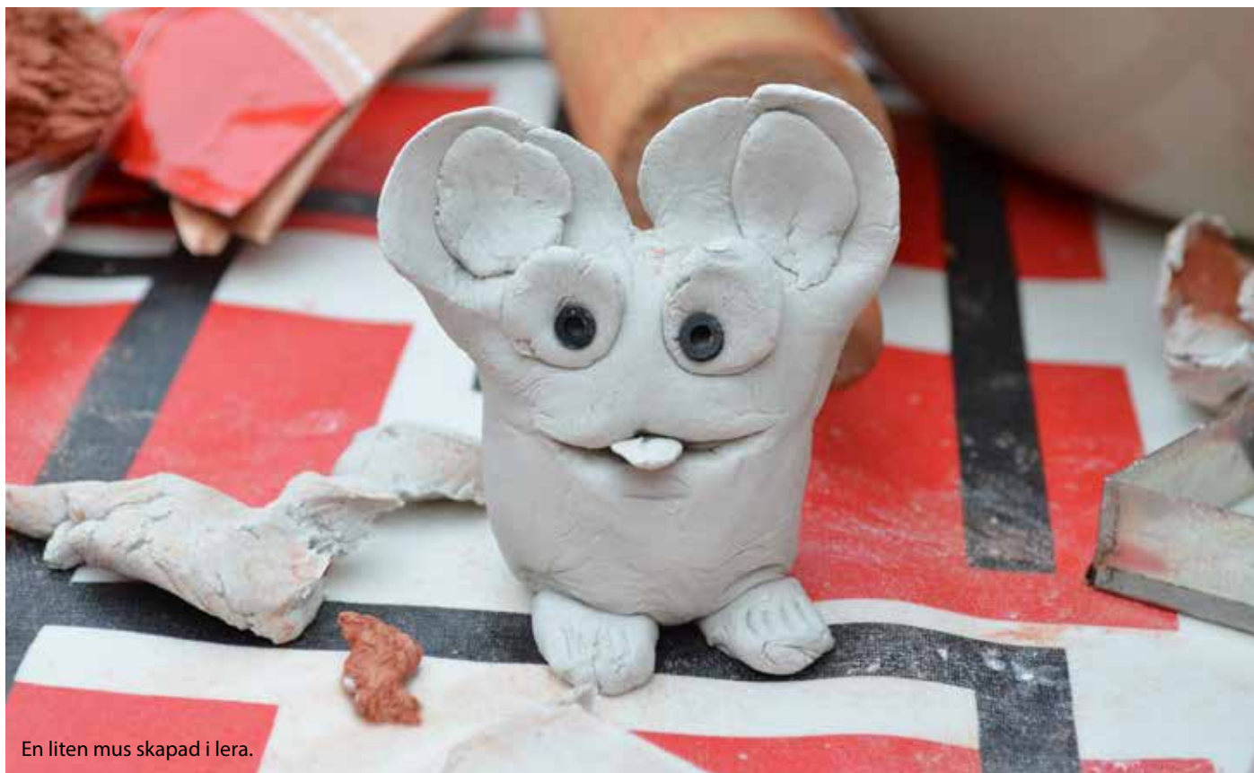
En liten mus skapad i lera.