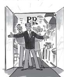
Vi vill vara er samarbetspartner

PR Active har genom åren ett utvecklat kontaktnät över hela världen. Det beror på att kunden alltid får översta vara till bästa möjliga pris.