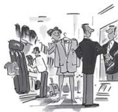
PR Active profilreklam

En av Sveriges ledande på effektiv och affärsskapande profilreklam!