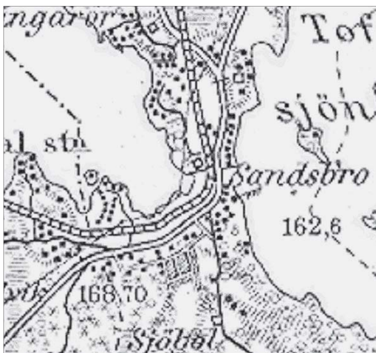
Sandsbrokarta från 60-talet.