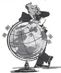
Vi känner hela tjocka släkten

En bra samarbetspartner lyssnar på kunden och sätter fart på sina egna eller för sin kunds den bästa och snabbast möjliga "vinstade" produktion till rätt pris.