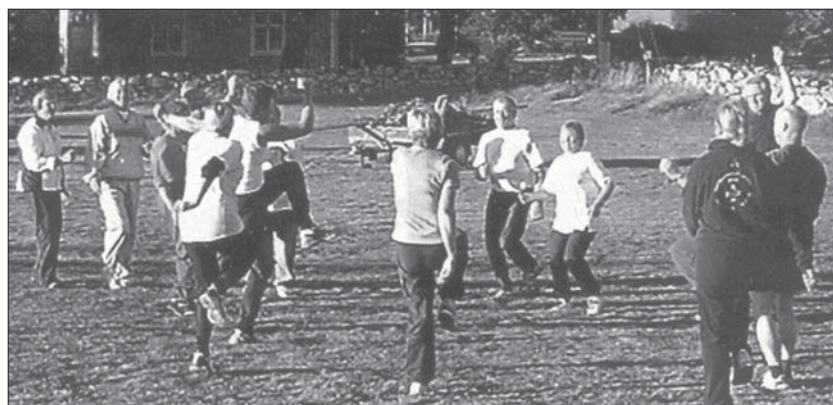
Håll formen i sommar