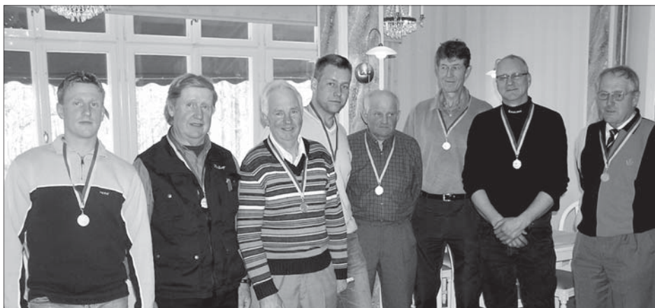
Hjältar efter januari-stormen, hyllade med medaljer på sockenrådets årsmöte april 2005.