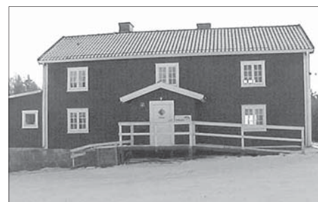
Fyllerydsstugan vid golfbanan i Sandsbro

Fyllerydsstugan, tfn 0470-650 50 Petersburg, tfn 0470-804 30