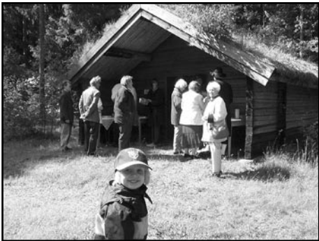
Ett av husen på hembygdsföreningen Hoppet – Linbastan.

Tiderna är annorlunda än 1952 då hembygdsföreningen grundades vilket gör att vi måste hitta nya former för hembygdsföreningen samtidigt som vi har ansvaret för hembygdsgården Hoppet och alla samlingar av saker från äldre tid i Gårdsby socken. Det som inte har förändrats är att en förening behöver både livaktiga medlemmar och en styrelse som leder föreningens arbete. Under senare tid har vi haft svårt att finna någon som har varit beredd att ta på sig ordförandeskapet vilket medför att föreningen inte blivit så livaktig som vi önskar.