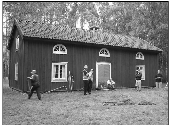
Stugan på Arnö, som vårdas av Hembygdsföreningen.