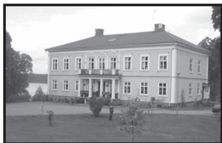
Den vackra huvudbyggnaden vid sjön Innaren