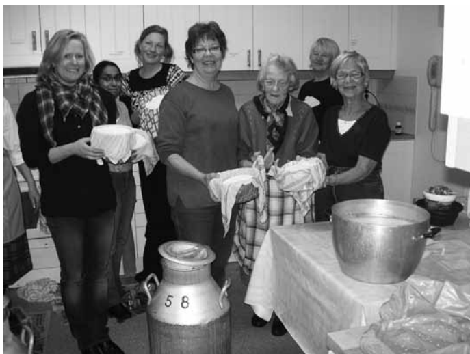
Några lyckans ostar med sina ostar.