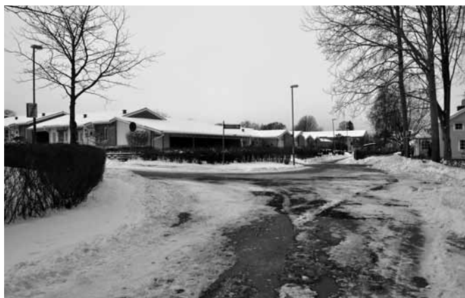
Det var här som Bäckmans sågverk låg och så här ser det ut idag.