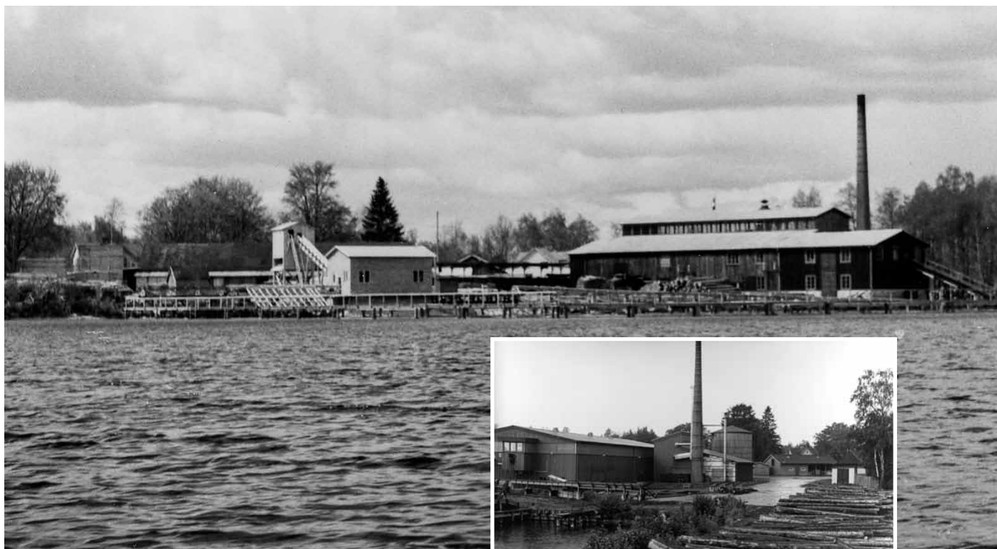
Den stora bilden på sågverket är från 1956 och den lilla bilden är från 1978.