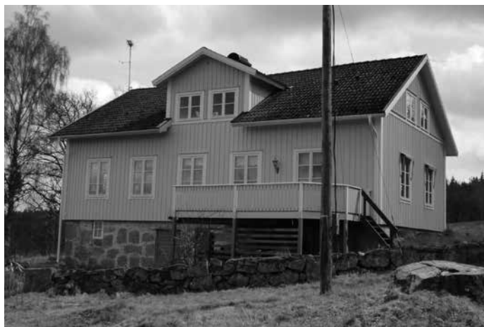
Gårdsby Klockaregård 2012

Många hus på landsbygden har en lång historia, ofta mer än hundra år. Församlingshemmet byggdes 1864 som skolhus med lärarlägenheter ovanpå vid samma tid som utvandringen till Amerika började ta fart. Husen har också en egen historia av förändringar och förbättringar.