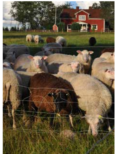
Tackor på bete.