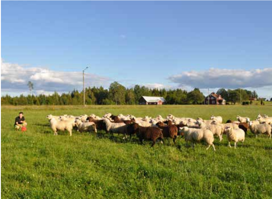
Nils och fler tackor.