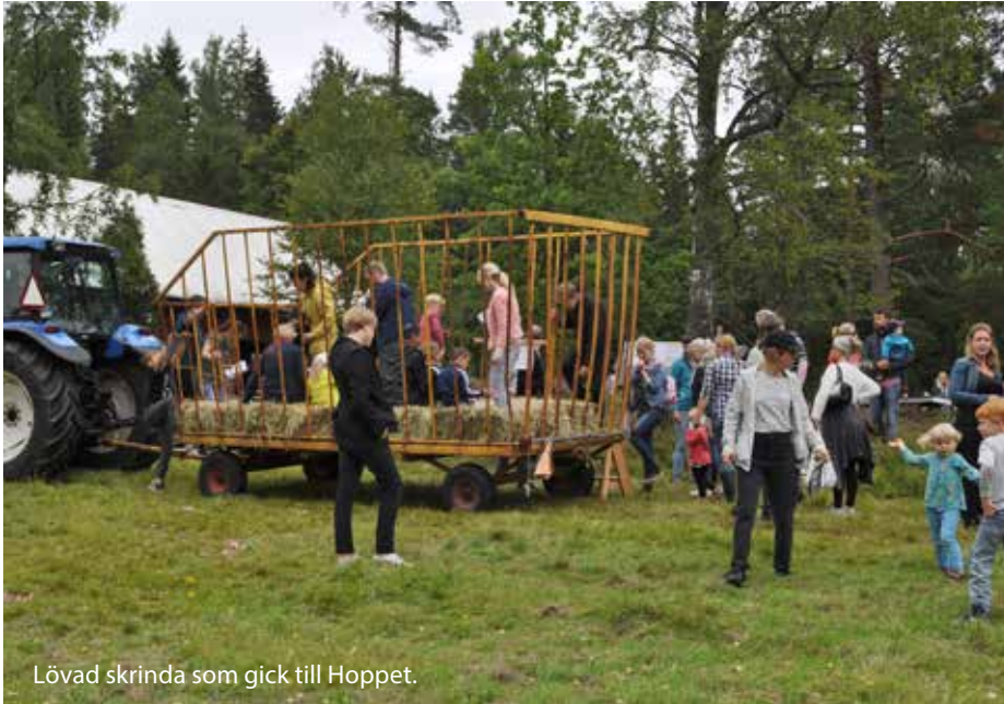
Lövad skrinna som gick till Hoppet.