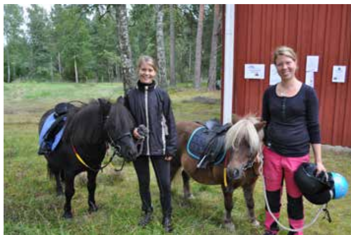
Tjejerna som höll i ponnyridningen.