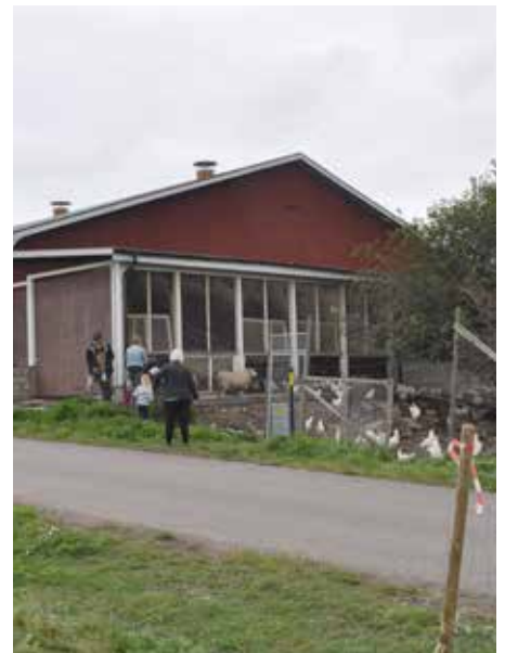
Här fick man titta på hönsen.