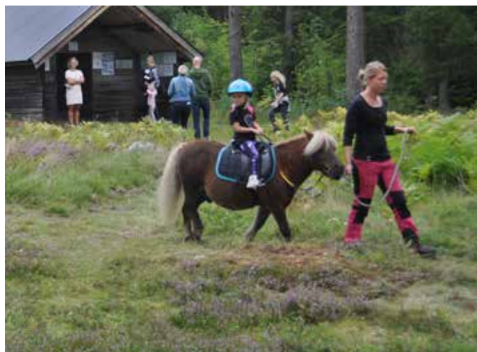
Ponnyridningen i full gång.