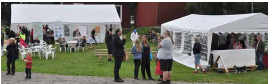
Möjlighet till en fika fanns det också.

Tack alla som kom till Gårdsby Tångshult och välkommen nästa år – då kör vi igen.