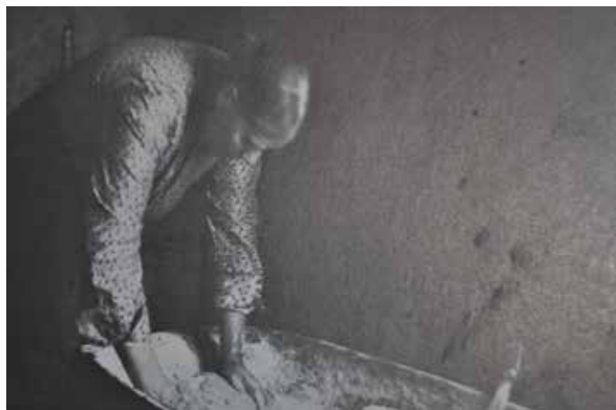
Storbak på gång.

Det var viktigt med julbrödet förr. Vörtlimpan är obligatorisk om man doppar i grytan. Bland det finare har saffran levt kvar som julens verkliga festkrydda. Man lade stor vikt vid julbaket. Finaste kryddorna togs fram. Ofta gav man brödet djur- eller fågelnamn. Det var så att karlarna ansvarade för något bakverk och det var unikt förr.