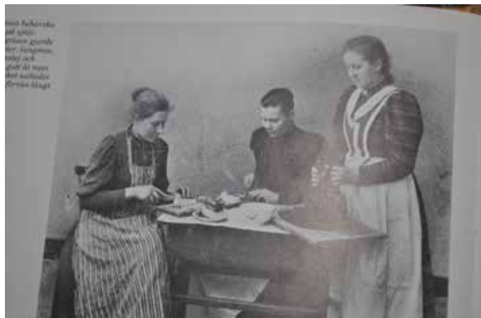
Här lagas det syltar och korvar