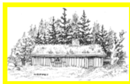
Gårdsby Sockens Hembygdsförening