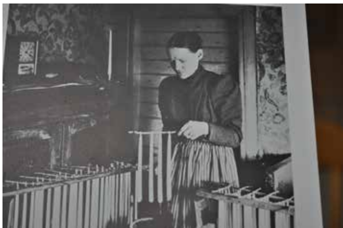
Här stöps det ljus.

I gamla tider var Tomasdagen/ 21 december fram till 1776 en helgdag och från och med denna dag börjar julhelgen. Idag 21 december vintersolståndet, under hednisk tid var det midvinterblotet. På Tomasdagen skulle ölet vara färdigbryggt. Provsamakades på Annadagen och så dracks det på Tomasdagen. På runkalendern finns det en ölkanna eller en öltunna inristad. På Gotland kallas denna dag för Tomas fylletunna. Tyngre arbeten på gården skulle nu vara avslutade. Redan nu var det helgfrid. Vanlig dag för marknader.