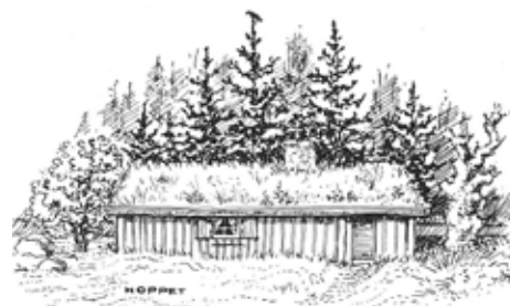
Gårdsby Sockens Hembygdsförening