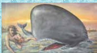
Jona och valfiskens