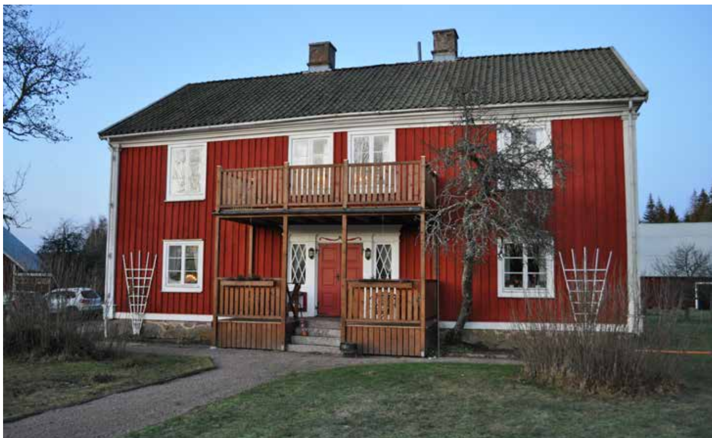
Så här ser Ryttartorpet ut idag.

(en tvåhundraårig berättelse om en gammal gård i Gårdsby socken)