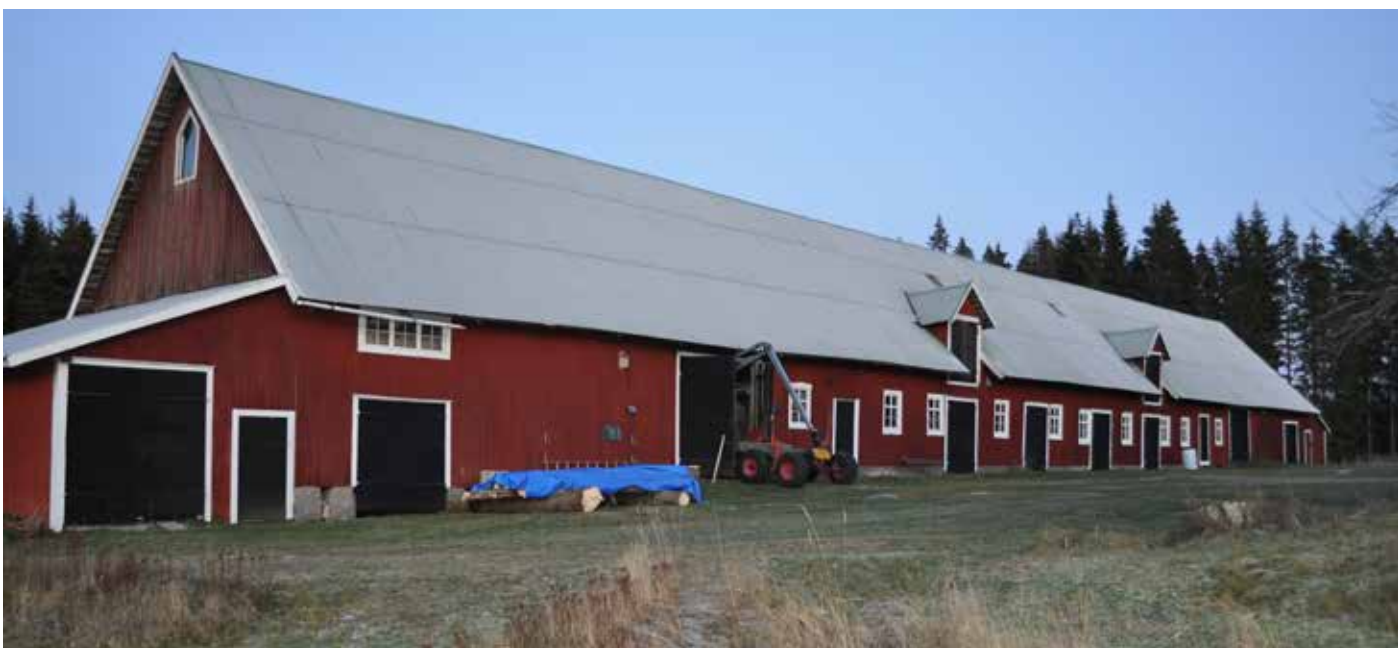
Ladugården på Ryttertorpets som är 97 meter lång.