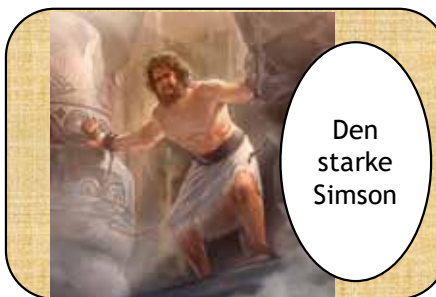
Den starke Simson