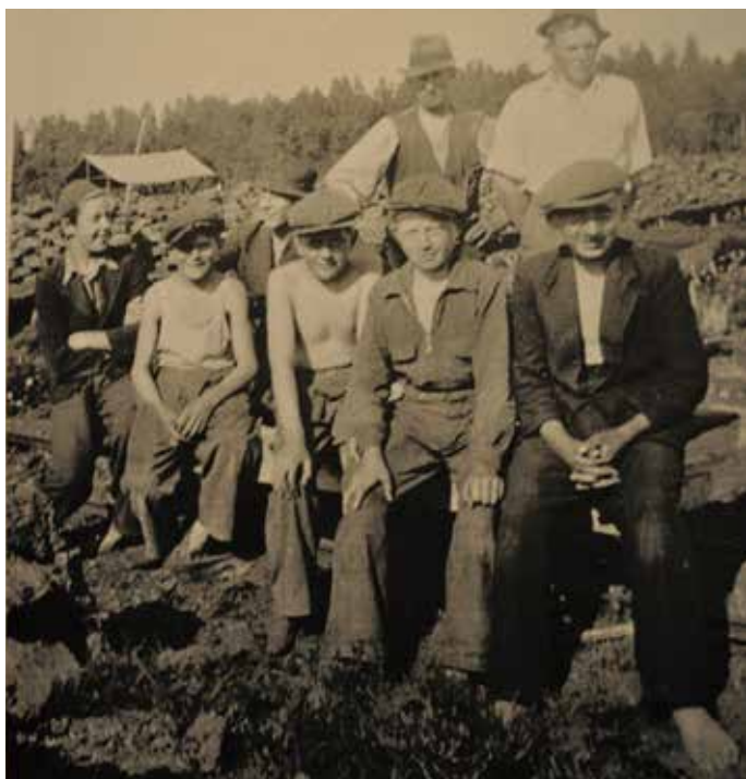
Ungdomar på Ryttertorpets runt 1930-talet.