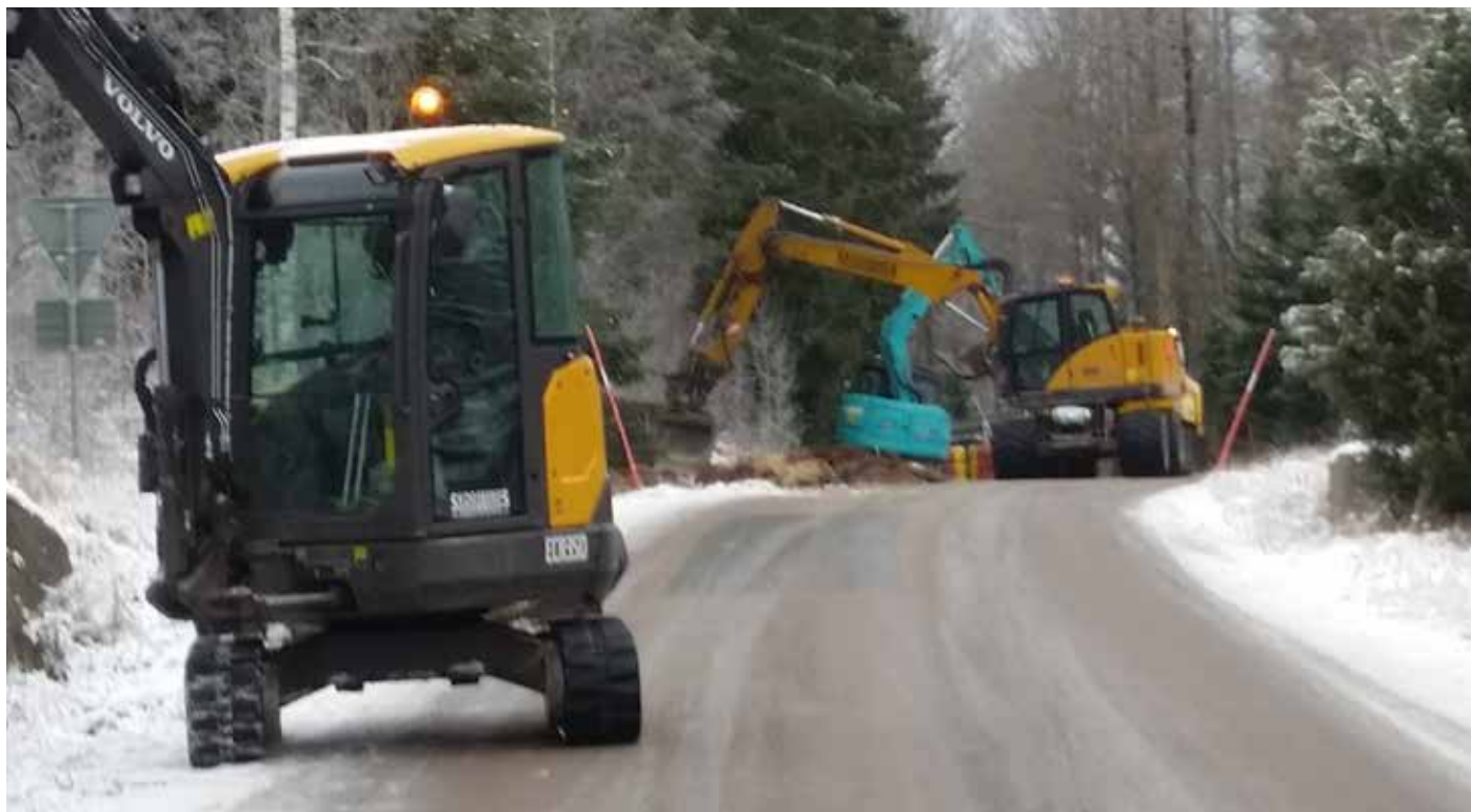
Grävning i Kårestad i december 2019.