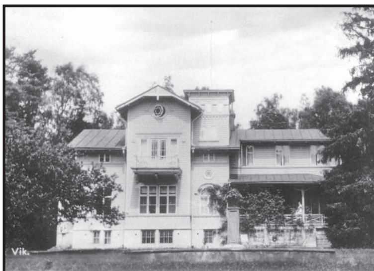
Villa Vik på Christina Nilssons tid.

1843 den 20/8 föddes hon på den lilla gården Snugge nära Huseby 1848 tvingades familjen flytta till en dagsverksstuga Lövhult 1855 hade hon varit ute på vägarna och sjungit i flera år och en tidning i Stockholm skrev om spelflickan Stina på Backen 1857 upptäcktes hon på Ljungby sommarmarknad och skickades till Halmstad, Göteborg och Stockholm för grundläggande utbildning i musik och språk 1860 fortsatte sångstudierna i Paris 1864 debuterade Christina som Violetta i La Traviata i Paris, sedan följde en lång karriär med stora roller i Europas operahus 1870 första turnén till Amerika, återbesök i USA 1872 och 1882 1872- 82 äktenskapet med fransmannen Auguste Rouzaud 1873 fick Christina de berömda smaragd- och diamantsmyckena av tsarfamiljen och publiken på operan i S:t Petersburg 1876 turné till Stockholm, Oslo, Köpenhamn och hembygen 1885 olyckan utanför Grand Hotell Stockholm med 18 döda 1887- 1902 äktenskapet med greve Angel de Casa Miranda 1888 gav Christina sin avskedskonsert i London 1906 köpte hon Villa Vik utanför Växjö och tillbringade delar av sina somrar där när inte världskriget hindrade hemresorna