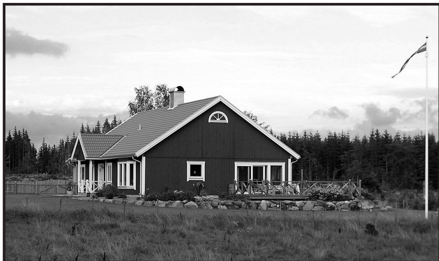
En dröm gick i uppfyllelse

Är det då något som blivit sämre efter flytten till Gårdsby, undrar jag till sist. - Nej, inget. Jo, det skulle i så fall vara att vi får lägga så mycket mer på taxi när vi varit ute i Växjös nattliv!