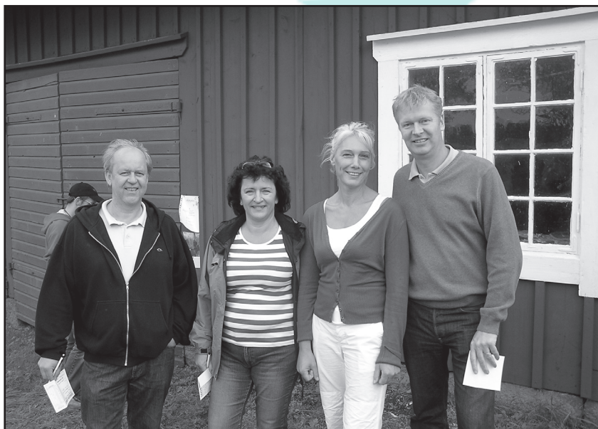
Glada besökare från Norra Åreda på Gårdsbydagen

PS. På www.gardsby.se finns bilder från de olika Gårdsbydagarna genom åren. Titta under Evenemang.