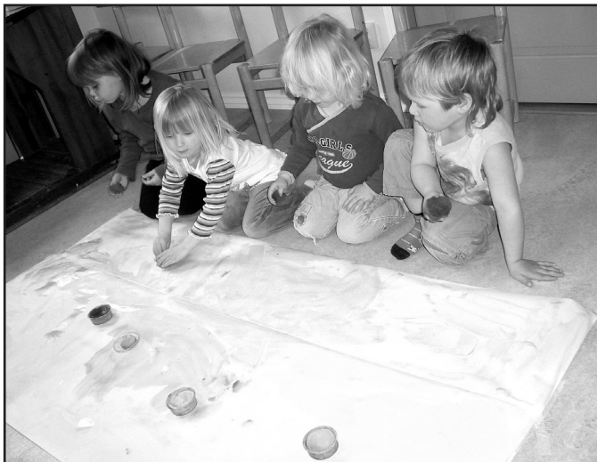
Barnen på Trollbacken gör en blomsteräng som det sen blev vackra tulpaner och fjärilar på