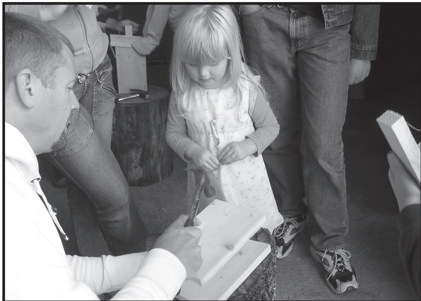
Är man liten så får man ha hjälp med fågelholksnickrandet!