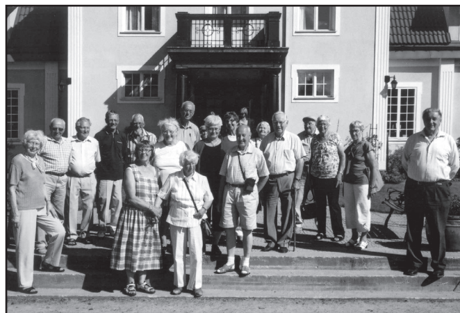
Från studiebesöket på nyöppnade Linnés Orangerigård i Möckelsnäs