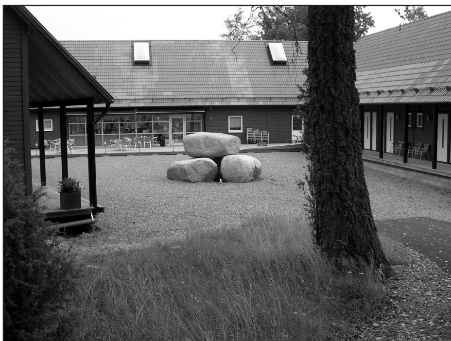
Hotell1s tilltalande innergård.

Hotell1s ”bakficka”, detsamma som golfbanans klubbhus, drivs också av paret Herrlin. Här erbjuder man daglig lunchservering.