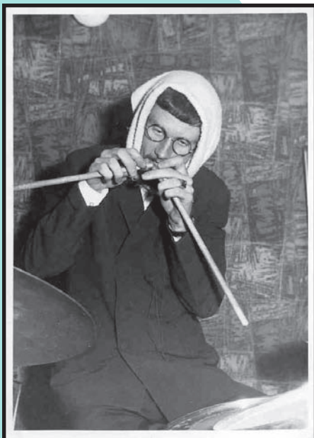
Det är inte bara musik som spelades utan en del spex hanns med också...