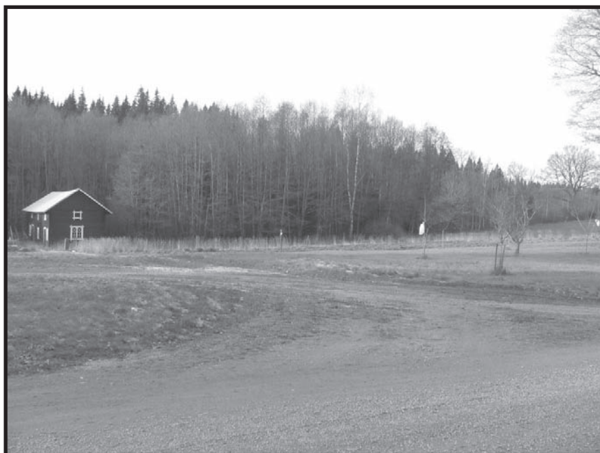
På denna plats låg Södragård.