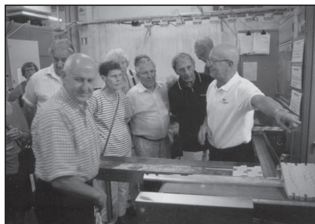
Här får PRO-gruppen en visning av Gemla Leksaksfabrik i höstas.