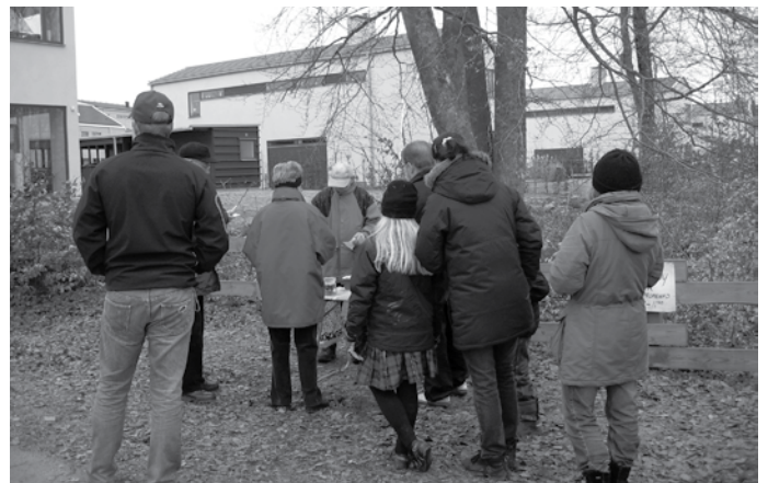
Den sedvanliga tipspromenaden i Sandsbro arrangeras av Gårdsby IK vår och höst, söndagar mellan 09.30-11.30.