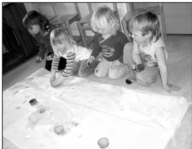
Barnen på Trollbacken gör en blomsteräng som det sen blev vackra tulpaner och fjärilar på