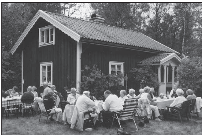
PRO på grillfest i Asa