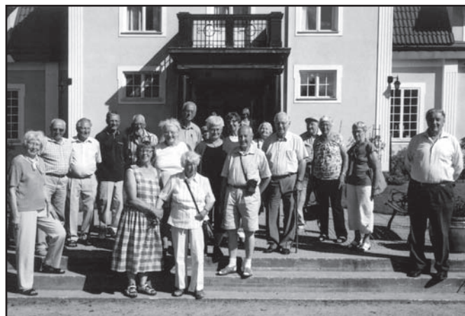
Från studiebesöket på nyöppnade Linnés Orangerigård i Möckelsnäs