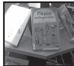
Biblioteket i Sandsbro mår bra.

- Varje fredag finns något inbokad här, fredagen är aktivitetsdag. Första fredagen varje månad är det gudstjänst, annars kan det till exempel vara folk som kommer och visar bilder. Alla är välkomna, det är bara att komma till matsalen 14.00 så är det alltid fika och något program. Intresserade kan komma hit och kolla programmet som sitter på anslagstavlan.