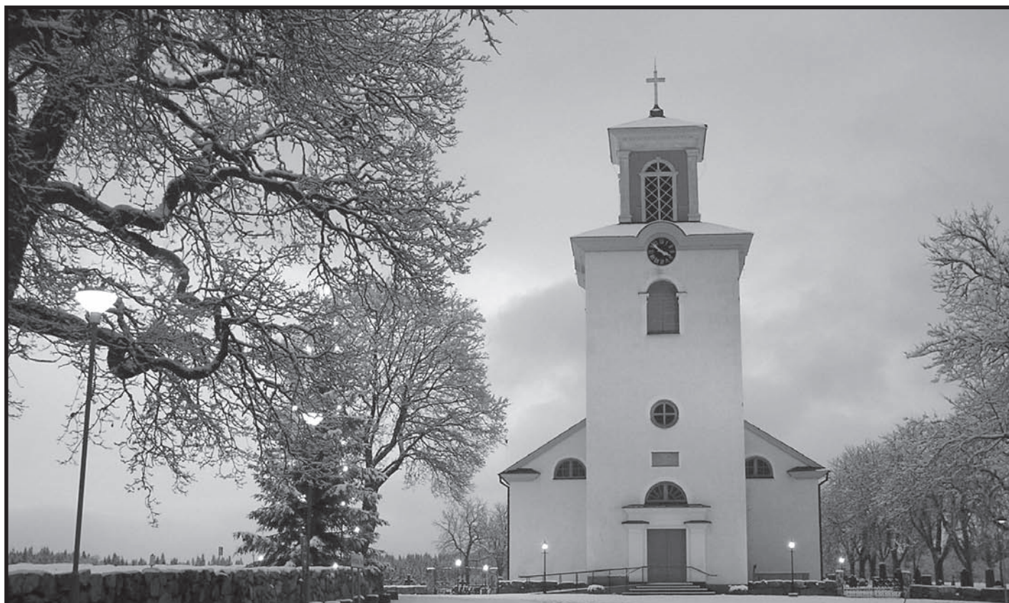
Gårdsby kyrka i vinterskrud.