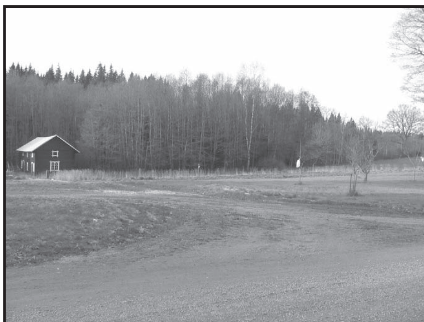
På denna plats låg Södragård.