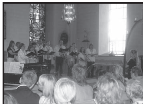
Konsert i Gagnef Kyrka, Dalarna.