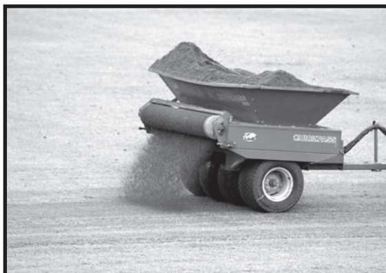
Dressmaskinen sprider ut sanden jämt över planen.