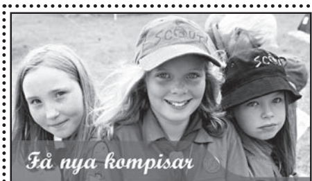
Få nya kompisar

Äventyr, få nya kompisar, skattjakt, få nya kompisar, hajk, få nya kompisar, läger, få nya kompisar, göra upp eld, få nya kompisar, ledarskap, få nya kompisar, tält, få nya kompisar... Listan kan göras oändlig. Är du intresserad? Allt hittar du hos scouterna!