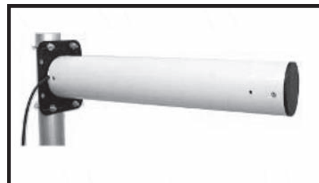
Exempel på riktantenn för bredband på landsbygden. Den monteras på taket eller husfasaden

bredbandsmöjlighet på landsbygden, och vi är glada över att denna möjlighet kommer. Vi vet också att utbyggnaden styrs direkt av hur många kunder företaget kan få i en viss trakt.