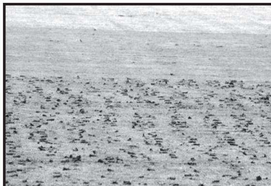
Efter bearbetning ser planen ut så här

Under hösten har ett stort och omfattande restaureringsarbete av fotbollsplanerna på Brinkvallen och Sandavi pågått under ett par veckors tid. Genom ett gott samarbete med Glasrikets golfklubb har det lånats både maskiner och kunskap om gräsytor. Det har skakats, luftas, sopats och slutligen så har nära 110 ton sand lagts ut på gräsytor. Vi kan i dag se att det har givit resultat. Genomrinningen är mycket god och planen är torrlagd. Efter alla moment som har gjorts så har planerna blivit mjukare och aktiviteten hos maskarna har ökat. Detta innebär att processen till en friskare plan fortsätter med hjälp av maskarna. Till våren kommer ytterligare en behandling ske. När allt är klart så har vi två mycket välmående och spelbara planer.