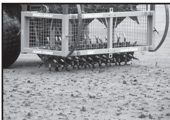
Pipluftaren gör massor av hål som senare fylls med sand.