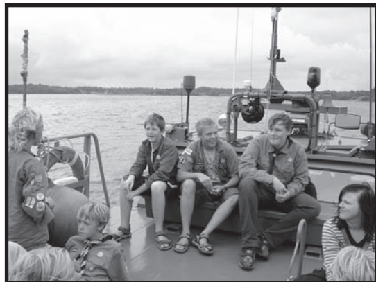
Resa med Sjöräddningens Stridsbåt 90

Den första dagen hade vi stadsorientering för att lära känna Karlskrona lite bättre. Sedan tog vi färjan ut till vår första campingplats på Dragsö. Dag två tittade vi på Marinmuseet och seglade med deras barkar från mitten av 1800-talet. Det var rätt vindstilla, så vi kom med nöd och näppe upp i en hastighet av 5 knop. Sedan flyttade vi till Tjurkö.