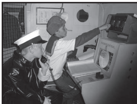
Arbete på en U-båt

Den sista dagen fick vi prova på att själva köra Stridsbåt 90 i en simulator. Vissa passade även på att prova på att jobba på en u-båt. Sedan vandrade vi runt och tittade på alla torgstånd och vackra båtar som fanns på "Sailt". Detta blev ett rätt annorlunda läger - dels fick vi prova på att åka med väldigt olika båtar, men vi fick också sätta upp och ta ner tälten tre gånger, och allt mat lagades på trangia-kök.