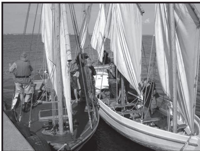
Marinmuséets barkar från 1800-talet

Patrullscouter från Eneröda, Växjö, Sösdala och Ronneby fick många spännande upplevelser under ett läger i Karlskrona skärgård. Under första augustiveckan arrangerade Region Syd av Nationella scoutförbundet lägret "Saltstänk 2006" i och runt Karlskrona. Det bjöds på många olika äventyr i vatten och på land.